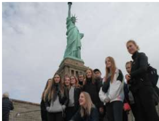
Drama & Performance elever i New York

Grundlaget for inklusionsforanstaltningerne vil være PPR udtalelser fra elevens hjemkommune og i samarbejde med elevens forældre.