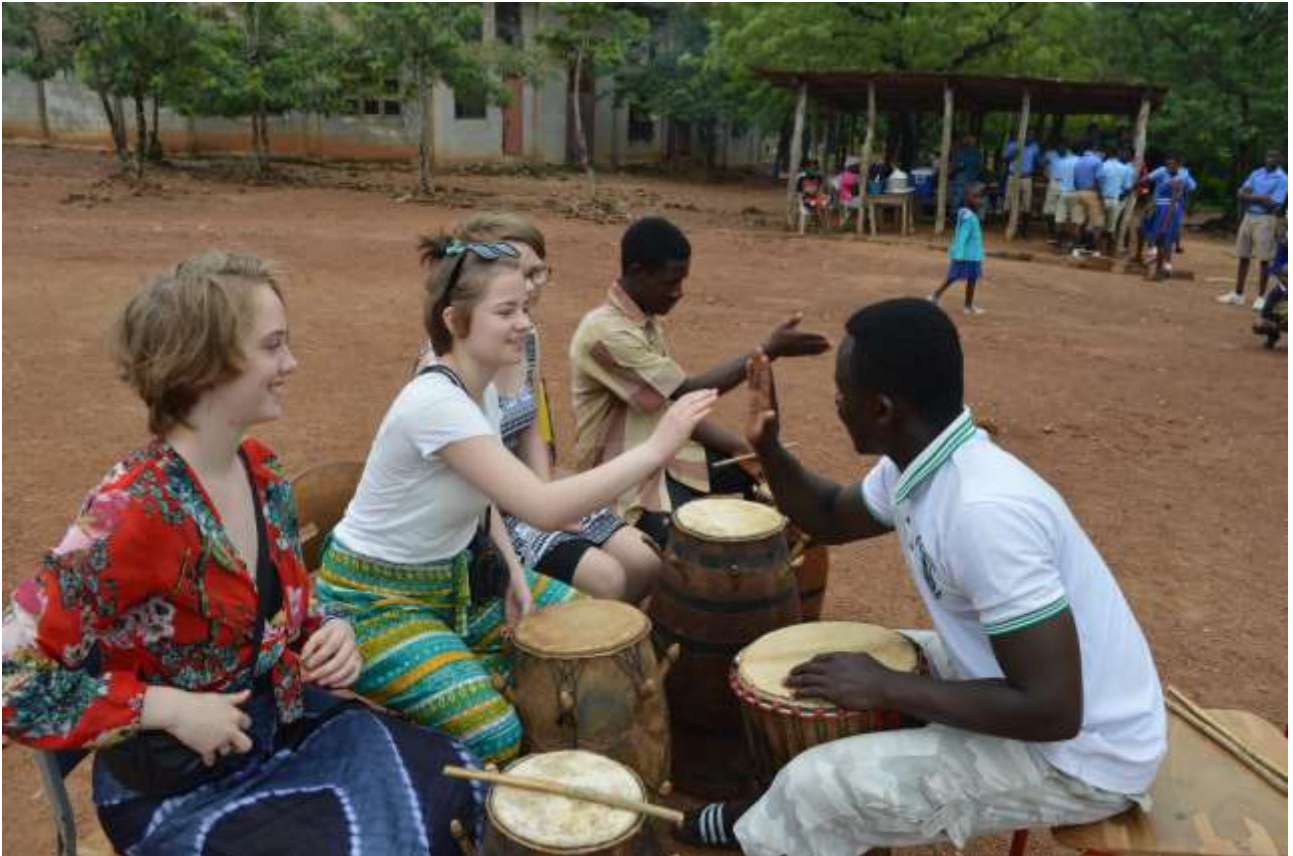
Global Projekt & Event - elever i Ghana