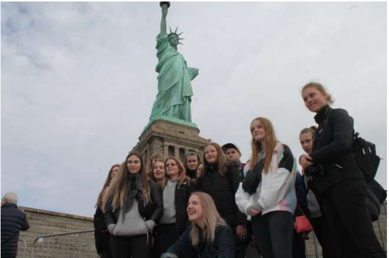
Drama & Performance elever i New York

Grundlaget for inklusionsforanstaltningerne vil være PPR udtalelser fra elevens hjemkommune og i samarbejde med elevens forældre.