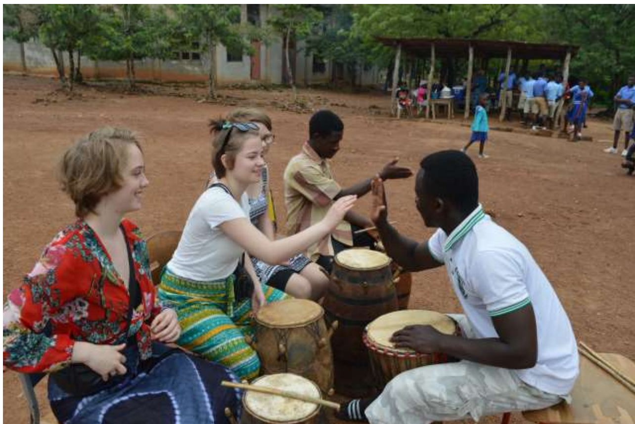
Global Projekt & Event - elever i Ghana

14: At opdage, at vi hele vort liv har brug for hinanden og at være noget for hinanden gennem erfaringer i dagligdagen, hvor der er brug for netop mig og mine bidrag.